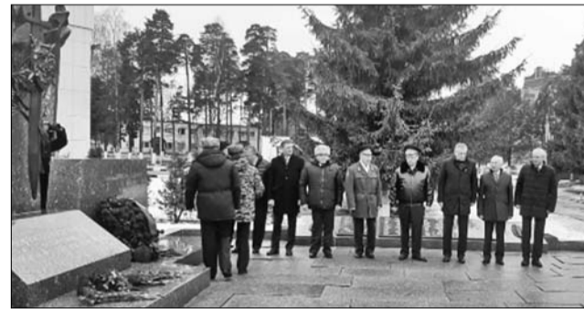
(Использованы информационные сообщения пресс-службы Законодательного собрания Ленинградской области и собственные материалы газеты «Ломоносовский районный вестник»)

Военнослужащие Росгвардии занимаются охраной общественного порядка, борьбой с экстремизмом и терроризмом, территориальной обороной страны и охраной особо важных объектов. Указ о создании войск Росгвардии президент РФ Владимир Путин подписал 5 апреля 2016 года. Отмечают День войск Росгвардии РФ 27 марта.