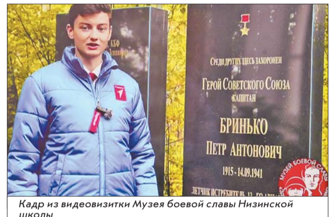
Кадр из видеовизитки Музея боевой славы Низинской школы

стия в телемосте собрался, можно сказать, актив актива – десятиклассники. На другом «берегу» – ребята из школы №113 города Донецка. Пять лет они учились дистанционно из-за того, что на их родине, поблизости от их домов и школы, шли боевые действия. И сейчас жизнь там совсем не спокойная. Но именно их школа не пострадала, не получила разрушений – чудом, как считают педагоги и ученики. А неподалёку, как сказала директор школы, прилёты были.