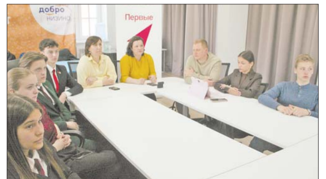
Центр культуры, спорта и молодёжной политики Низинского сельского поселения. Телемост со школой №113 г. Донецка 27 апреля 2026 года