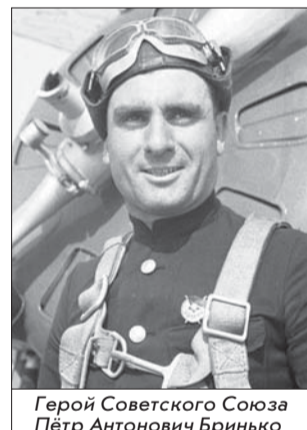
Герой Советского Союза Пётр Антонович Бринько

Актив Музея боевой славы Низинской школы многочисленный. 27 апреля для уча-