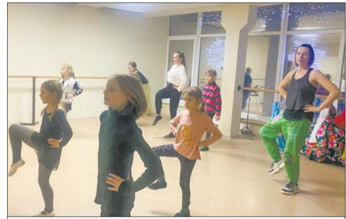
Глобичский дом культуры

— так говорят про сферу культуры. И это на все 100 верно про тех, кто несёт культуру в массы в Лопухинском сельском поселении. Культура ведь не ограничивается стенами одного здания. И даже двух: кстати, в Лопухинском поселении два ДК, которые объединены в одно муниципальное учреждение под названием «Лопухинский дом культуры» — один небольшой, но сплочённый, дружный коллектив. Один очаг, который согревает всё вокруг.