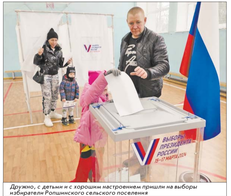
Дружно, с детьми и с хорошим настроением пришли на выборы избиратели Ропшинского сельского поселения

За Владимира Путина проголосовало почти 88% избирателей. На втором месте расположился Николай Харитонов (4,44%), на третьем – Владислав Даванков (3,88%), а на четвертом – Леонид Слуцкий (2,23%).