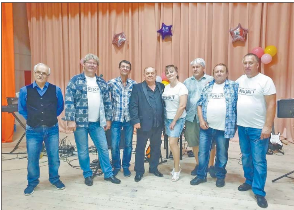
ВИА «Горизонт» и его друзья

министративной области Ленинградской области реабилитационных центров СВО. Отработали репертуар — от сосредоточенно-патристической тематики до жизнерадостных песен — подготовили соответствующие костюмы (благо, костюмами разного стиля местная администрация ансамбля вполне обеспечила). И конечно же, решили ответить нашим воинам что-то вкусное, от души, чтобы чайку могли попить. Собрали сладостей столько, что в машину еле-еле поместилось! И поехали.