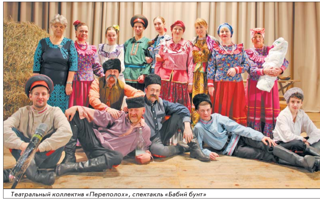
Театральный коллектив «Переполах», спектакль «Бабий бунт»