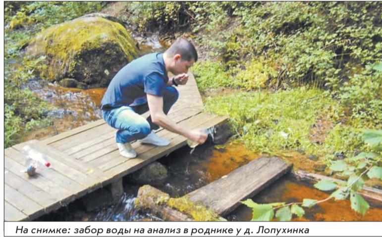
На снимке: забор воды на анализ в роднике у д. Лопухинка

Несоответствие нормативам качества воды обусловлено не только антропогенной нагрузкой на нашу