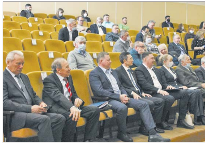
На отчетном собрании присутствуют депутаты Законодательного собрания Ленинградской области, представители поселений, депутаты районного и местных советов

«Я бы хотел обратить внимание на эффективность предоставления поддержки субъектам малого и среднего предпринимательства. Пока я не вижу реального результата. И это нужно менять. Объединяйтесь с молодежным центром, начинайте использовать коворкинг в Большой Ижоре, есть смысл подумать о соз-