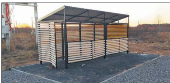
Площадка в Пениковском поселении