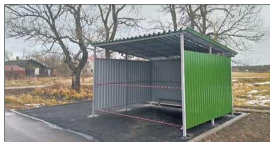
Воронино (Лопухинское СП), ул. Парковая

Информация предоставлена сектором природопользования администрации Ломоносовского муниципального района