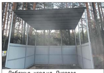
Лебяжье, угол ул. Луговая и Сосновая