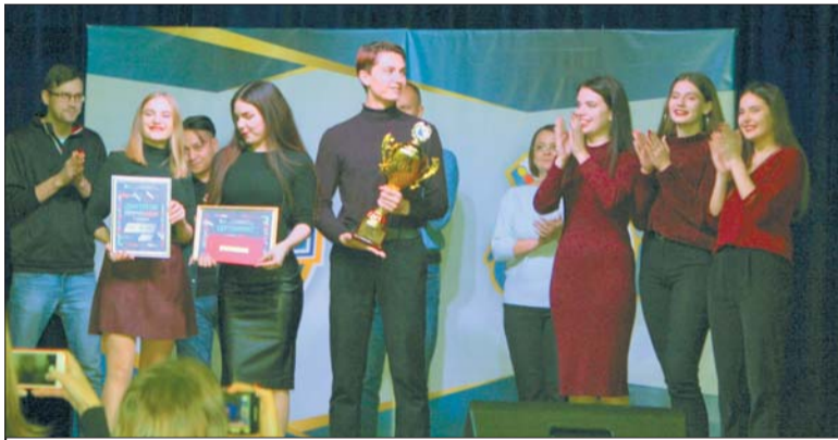
Команда «С' est la vie» (Се Ля Ви)