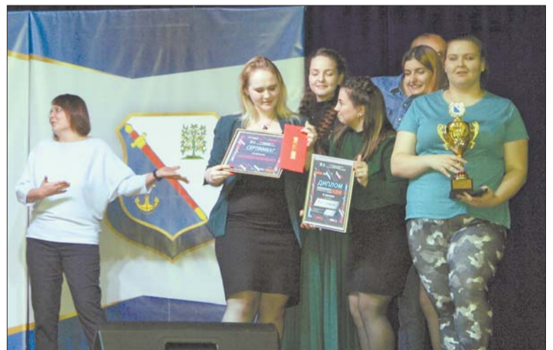
Команда «Всё сложно»