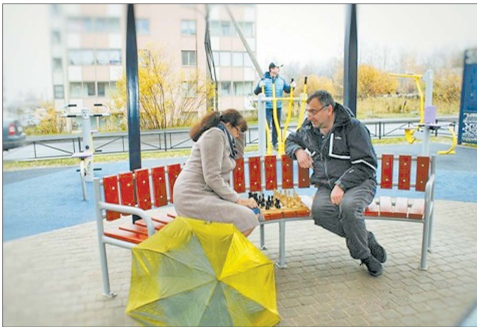
Двор на ул. Центральной в Низино (Низинское сельское поселение)