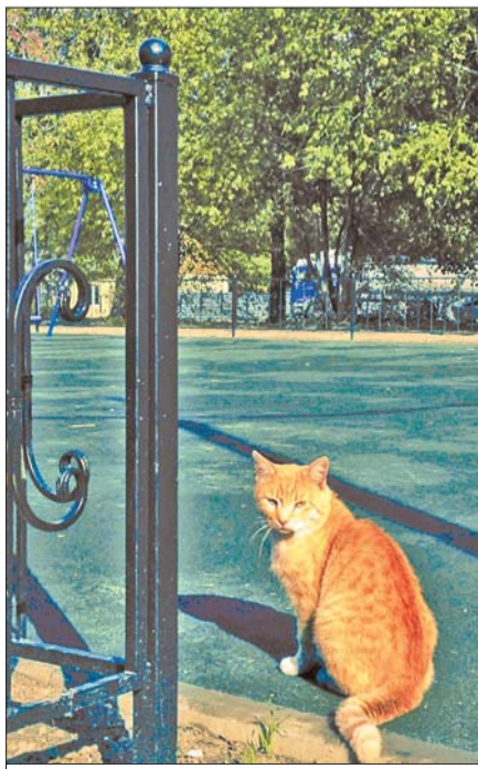
Двор в Копорье (Копорское сельское поселение)