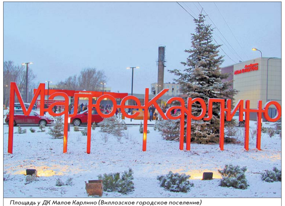
Площадь у ДК Малое Карлино (Виллозское городское поселение)

Сделать красивым двор – задача пусть менее масштабная, но тоже очень важная. Ведь