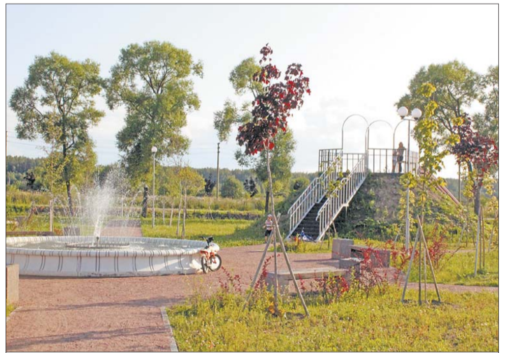
Сад с фонтаном и горкой в Новоселье (Аннинское городское поселение)