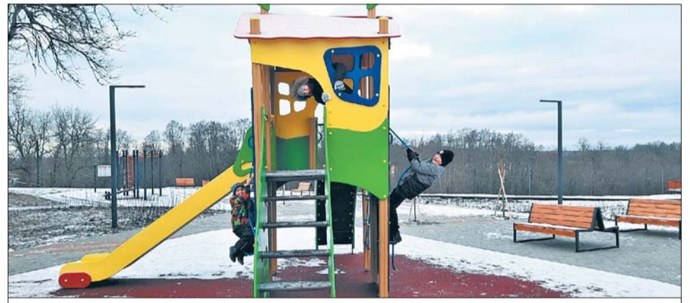
Комфортная среда – 2-я очередь завершена

Кроме работ по «комфортной городской среде», за минувший год в Оржицком сельском поселении было сделано ещё немало, чтобы жители чувствовали себя комфортно и безопасно. Например, по государственной программе «Устойчивое общественное развитие в Ленинградской области» были сделаны автостоянки у домов 11, 14, 15, 20, 25 и установлено ограждение детской площадки у дома 24. Восемь асфальтированных парковок, обрамлённых бордюром камнем, выглядят аккуратно; автомашин, которых теперь в десятки раз больше, чем в то время, когда строились многоквартирные дома в Оржицах, ставить удобно – и туфли не испачкаешь, выходя, и газоны не портятся колёсами. Места детских игр ограждены от транспорта: мало ли что может произойти на дороге!