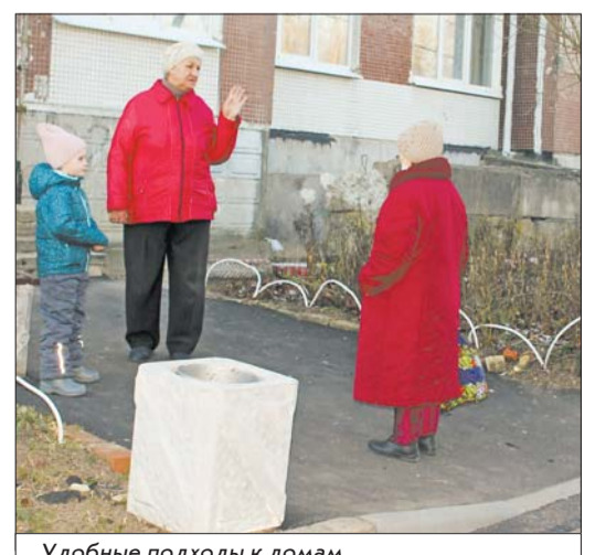
Удобные подходы к домам