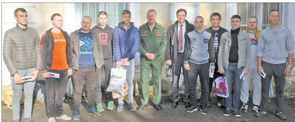
Отправка призывников из Ломоносовского района на военную службу по весеннему призыву 2019 года

Адрес военного комиссариата: 198412, город Ломоносов, Иликовский пр., д. 1А. Телефон: 8-812-422-64-45.