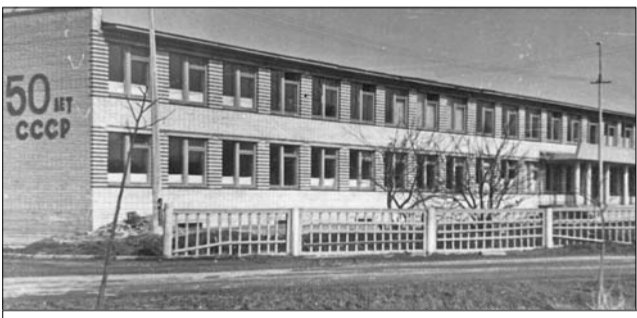
Русско-Высоцкая школа в советское время

Муниципальное образовательное учреждение «Русско-Высоцкая общеобразовательная школа» в эти дни принимает официальные и дружеские поздравления в связи с 50-летием со дня своего открытия.