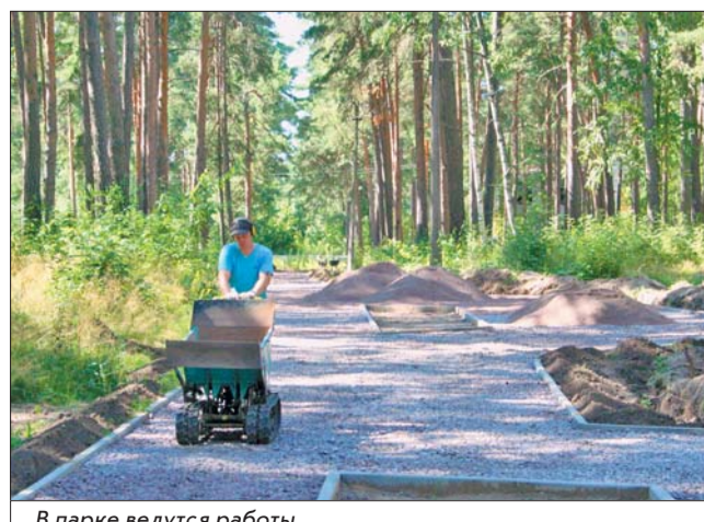
В парке ведутся работы