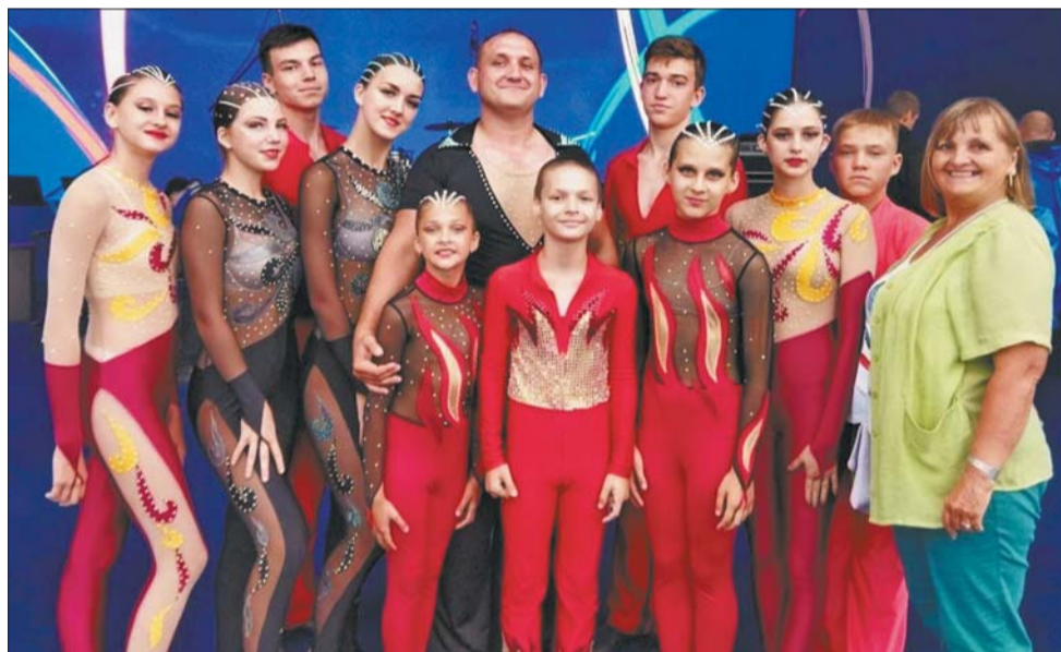
«Арлекин» выступил в концерте звёзд российской эстрады и оперы на праздновании 95-летия Ленинградской области в городе Сосновый Бор