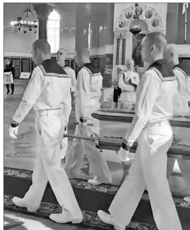
Перенесение мощей св. прав. воина Фёдора Ушакова на адмиральский катер