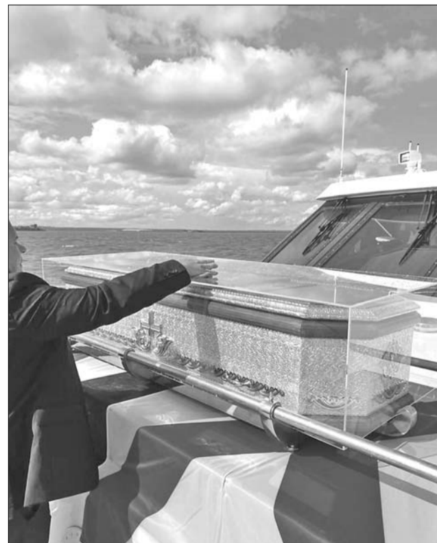
Рака с мощами св. прав. воина Фёдора Ушакова на адмиральском катере