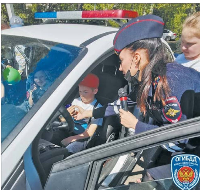
В День защиты детей – первое знакомство ребят с ГИБДД (снимок со страницы группы «ОГИБДД по Ломоносовскому району ЛО» ВКОНТАКТЕ)