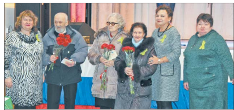
Вручение Памятных знаков в деревне Оржицы

Вместе с наградой вручались подарки от администрации Ломоносовского муниципального района. Особый памятный подарок для блокадников Ломоносовского района изготовили на предприятии