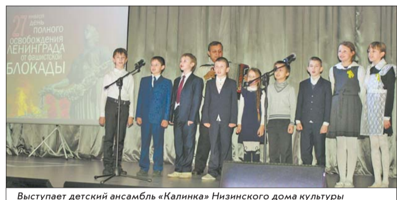
Выступает детский ансамбль «Калинка» Низинского дома культуры