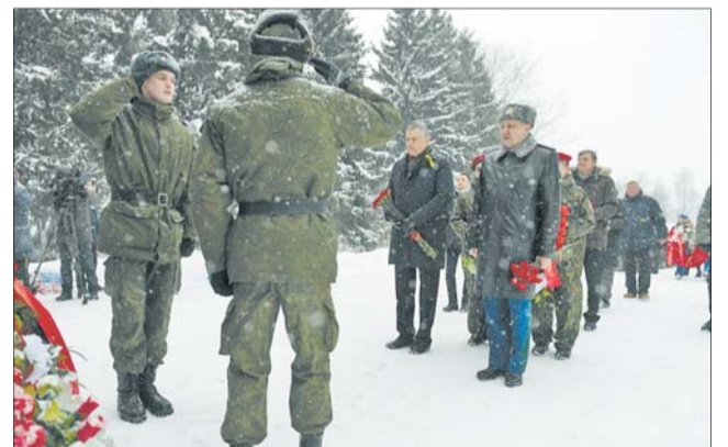
Возложение венков и цветов к памятнику «Январский гром» 26 января 2019 года

26 января у памятника «Январский гром» на Гостилицком шоссе в 8-й раз прошла реконструкция боя возле деревни Порожки — деревни, через которую 14 января 1944 года проходило наступление на Гостилицы и которой больше нет. Но место под названием «Урочище Порожки» осталось