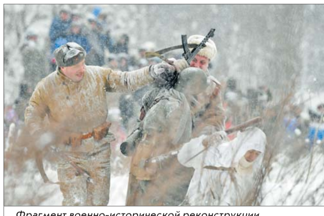
Фрагмент военно-исторической реконструкции