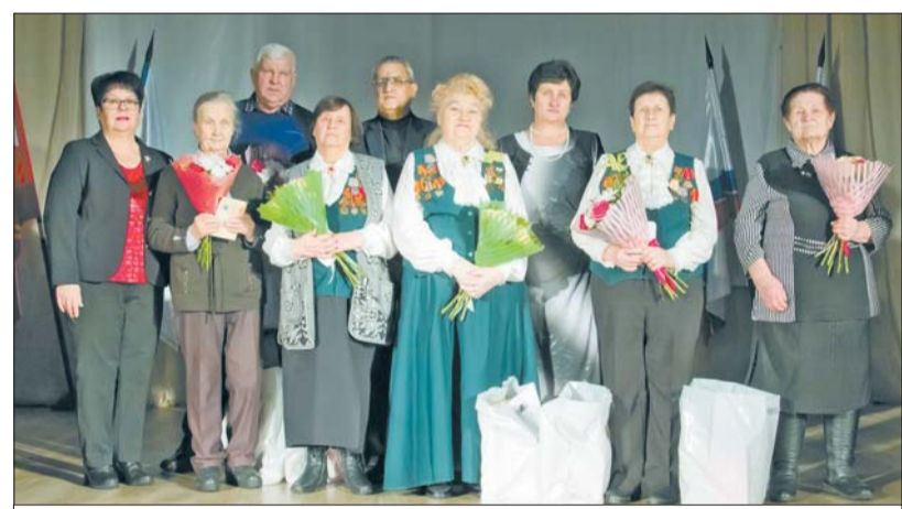
Вручение Памятных знаков в Гостилицком доме культуры