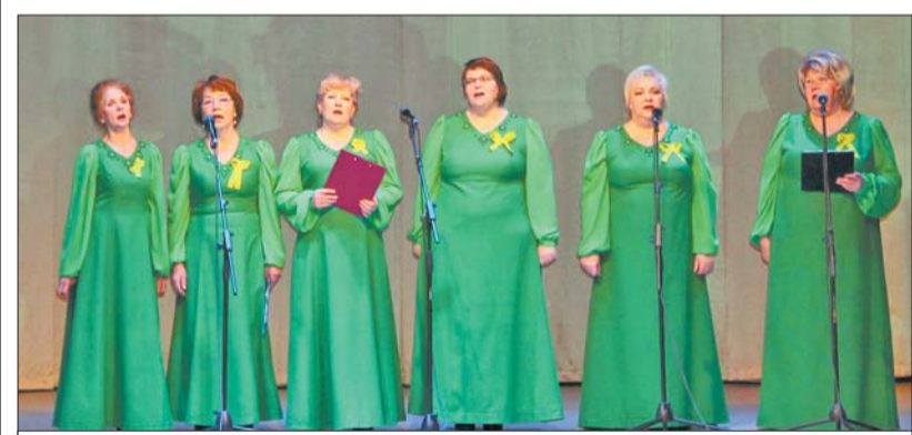
Концерт в Оржицком культурно-спортивном комплексе

«Керамин-Санкт-Петербург» – настоящие часы с изображением символов юбилейной даты – 75-летия полного освобождения Ленинграда от фашистской блокады.