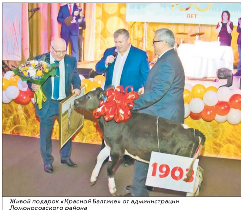
Живой подарок «Красной Балтике» от администрации Ломоносовского района