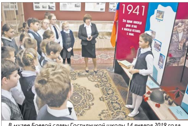
В музее Боевой славы Гостилицкой школы 14 января 2019 года