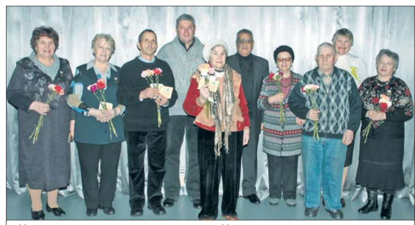
Награждение в доме культуры деревни Низино