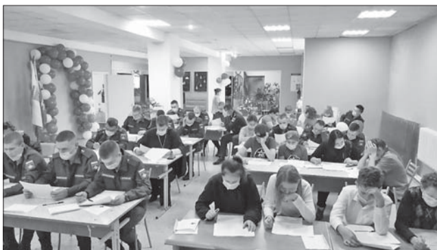
– Площадка на базе Дома культуры посёлка Малое Карлино