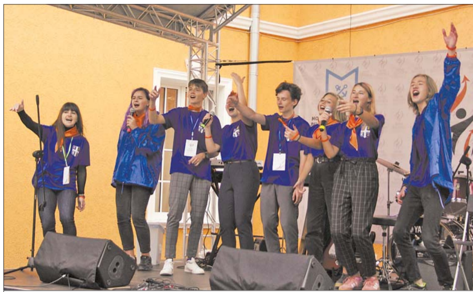
«Визитная карточка» команды Низино