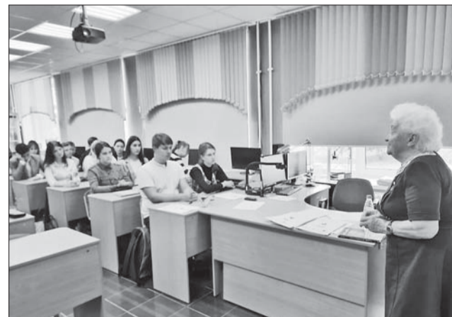
Площадка на базе Ломоносовской школы №3

По словам секретаря Генсовета «Единой Рос-