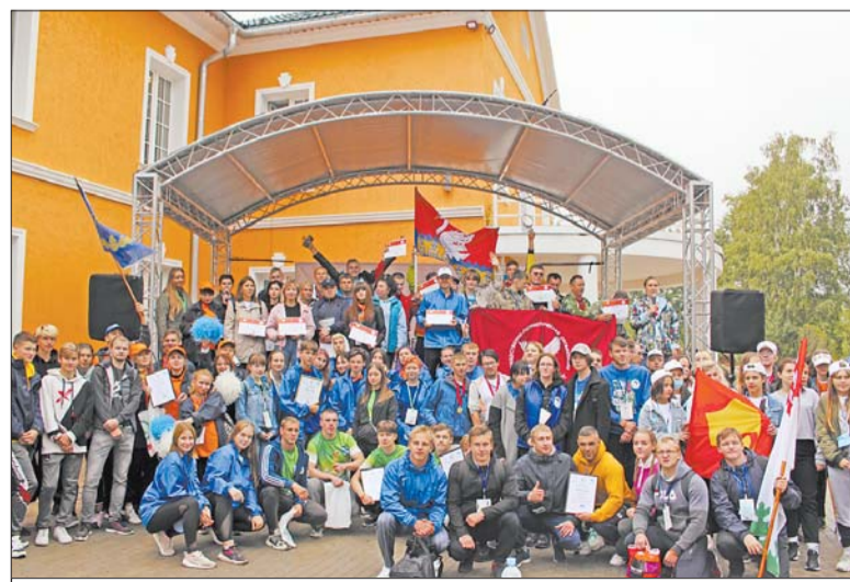
Финальный общий снимок участников Фестиваля