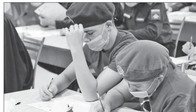
– В Малом Карлино пишут «Диктант Победы»