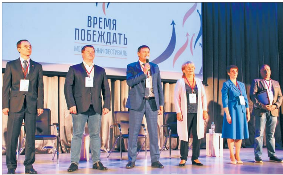
Торжественное открытие Фестиваля