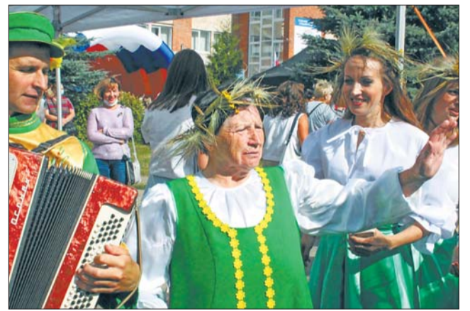
Фотоальбом – в группе «Ломоносовский районный вестник» ВКОНТАКТЕ