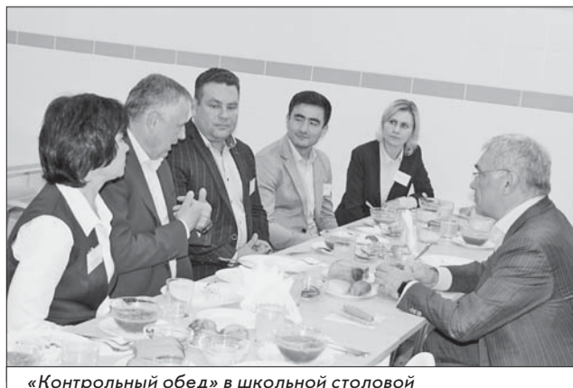
«Контрольный обед» в школьной столовой